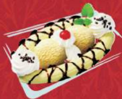
BANANA SPLIT Vanille mit Schokoladensauce Fr. 10.00