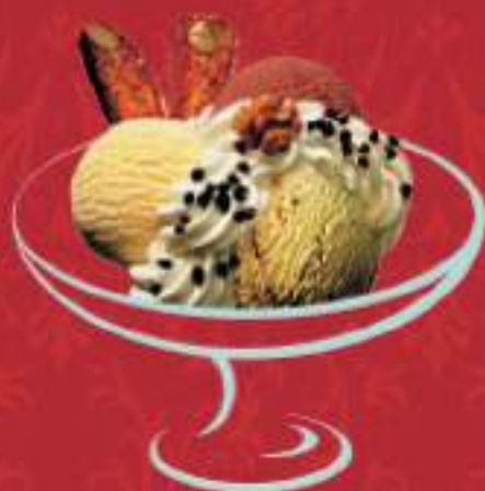
SUISSE Vanille, Haselnuss, Chocolat und Rahm Fr. 10.00 Mini: Fr. 8.00