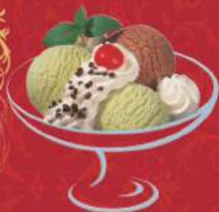
NAPOLI Chocolat, Pistaché Fr. 10.00 Mini: Fr. 8.00