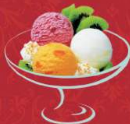
GOOG TO GO Banane, Sorbet Zwetschgen Sorbet Mango mit Früchten garniert Fr. 10.00 Mini: Fr. 8.00