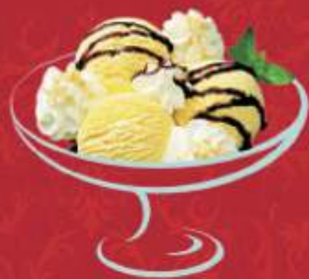
DANEMARK Vanille, Schokoladensauce und Rahm Fr. 10.00 Mini: Fr. 8.00