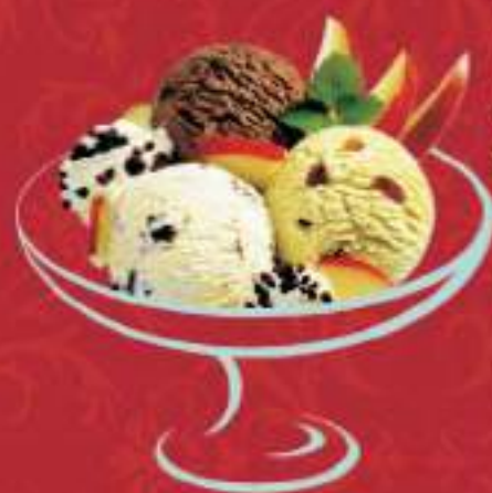
MODERN DANCE Jamaïque, Chocolat, Straciatella Fr. 10.00 Mini: Fr. 8.00